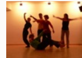
zum Wohl fühlen können